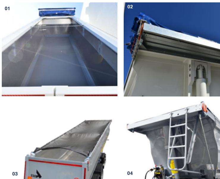
01 recubrimiento de teflón en suelo y paredes laterales 02 toldo corredero Cramaro 03 toldo corredero Cramaro tipo "malla" 04 escalera en frontal

Ofrecemos para cada STAR una gran variedad de paquetes opcionales. Descubra las opciones especializadas en www.stas.be/buildstarX o en el distribuidor de su zona.