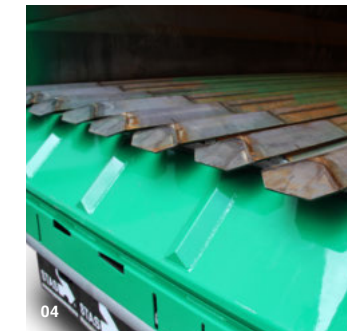
01 toldo manual 02 y 03 sistema de barrido con recogida automática "cleansweep" 04 suelo móvil V-Floor de Keith Walking Floor (acero)