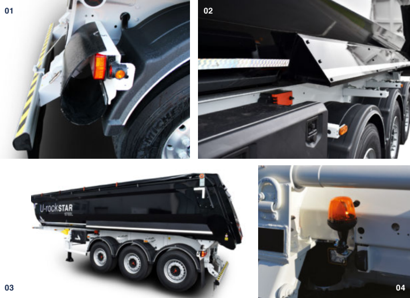
01 protección de luces traseras en descarga de asfalto 02 y 03 protector de aletas laterales 04 girofaro en trasera

Ofrecemos para cada STAR una gran variedad de paquetes opcionales. Descubra las opciones especializadas en www.stas.be/urockstar o en el distribuidor de su zona.